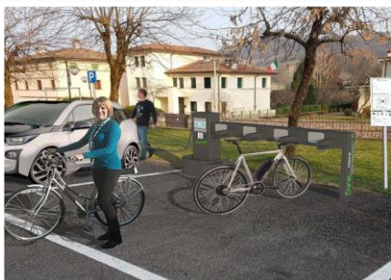
Stazione di ricarica elettrica