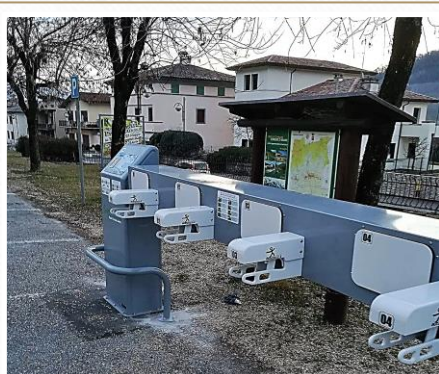
Piazzola per la mobilità sostenibile ed e-bike